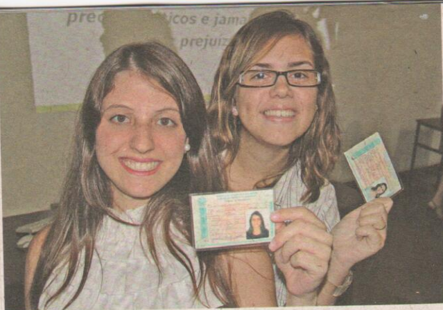
Duas das novas profissionais, felizes com a conquista da carteira do CRF